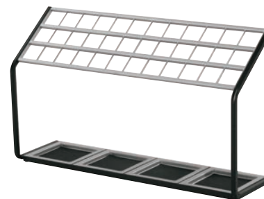
③かさたて US-MV 36本用 ㊦

外寸:450×240×H500 重量:2.9kg 材質:天板・台座・フレーム・受け皿/スチール(粉体塗装) マット/合成ゴム