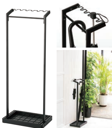
④傘かけ (おりたため傘対応) ㊦

外寸:870×240×H500 重量:4.6kg 材質:天板・台座・フレーム・受け皿/スチール(粉体塗装) マット/合成ゴム