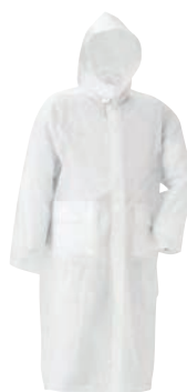
⑧EVALレインコート クリア ㊦

サイズ:フリーサイズ 総丈:1,070/970(前/後) 袖丈:730 材質:シングルビニール 重量:380g