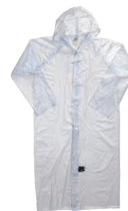
⑨ポケットレインコート