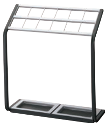
①かさたて US-MV 12本用 ㊦