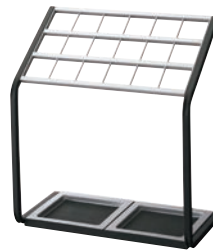
②かさたて US-MV 18本用 ㊦

外寸:450×170×H500 重量:2.2kg 材質:天板・台座・フレーム・受け皿/スチール(粉体塗装) マット/合成ゴム