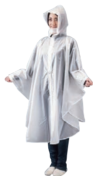
⑦レインウェア EVA ポンチョ E-802A クリア ㊦

外寸:215×215×H450 重量:1.5kg 材質:本体/スチール(粉体塗装・クロムメッキ) 口蓋・台座/ポリプロピレン マット/合成ゴム ●スチールメッシュとロッドを使った多彩なフォルムとデザイン。